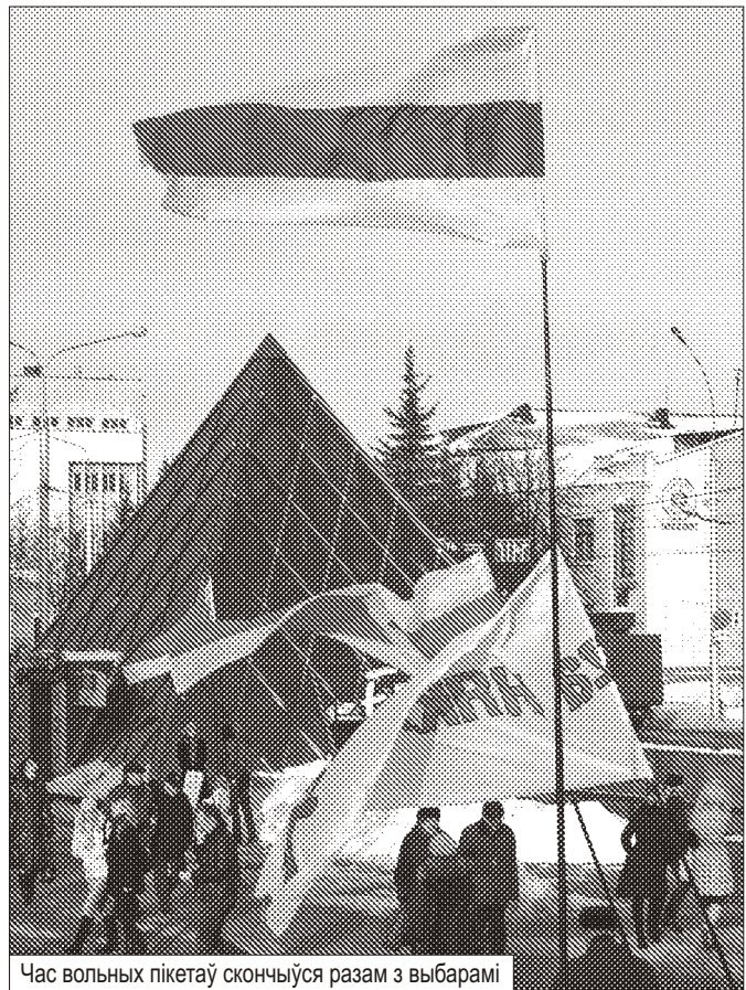
Час вольных пікетаў скончыўся разам з выбарамі